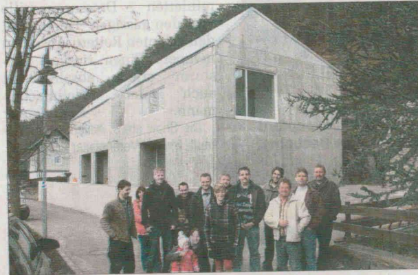
Die Handwerker und Besucher zur Einweihung des neuen Mehrfamilienhauses in der Elsterstraße.

Fünf Wohnungen auf zwei Etagen sind auf dem Gelände entstanden, wobei die drei grundrissgleichen Parterre-Wohnungen senioren- und behindertengerecht sind. Neben